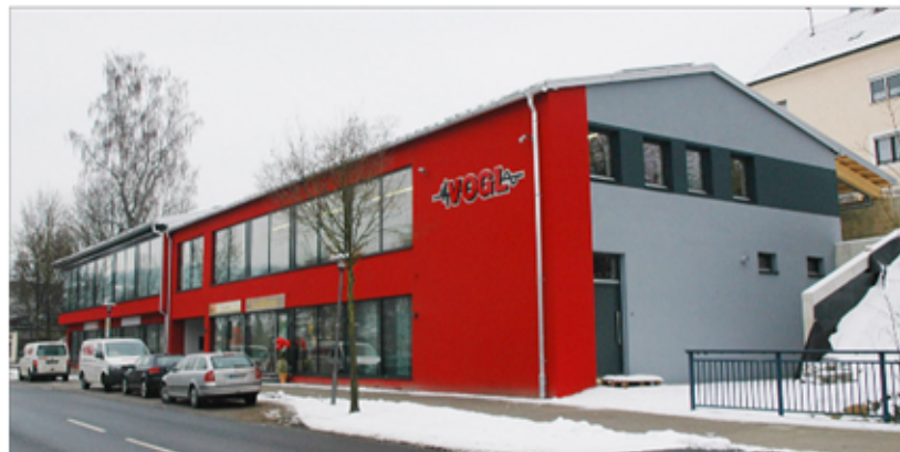
Modern und freundlich präsentiert sich das neue Firmengebäude in der Bahnhofstraße 12.

Elektroanlagen • Schaltschrankbau • MSR-Technik